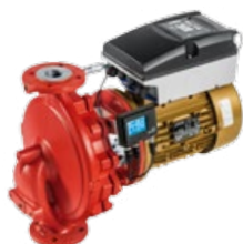
Etaline avec moteur KSB SuPremE®-IE5 *, PumpMeter et PumpDrive 2 Eco

Pour plus d'informations: www.ksb.com/produits