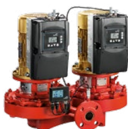
Etaline Z avec moteur KSB SuPremE®-IE5 *, PumpMeter et PumpDrive Eco