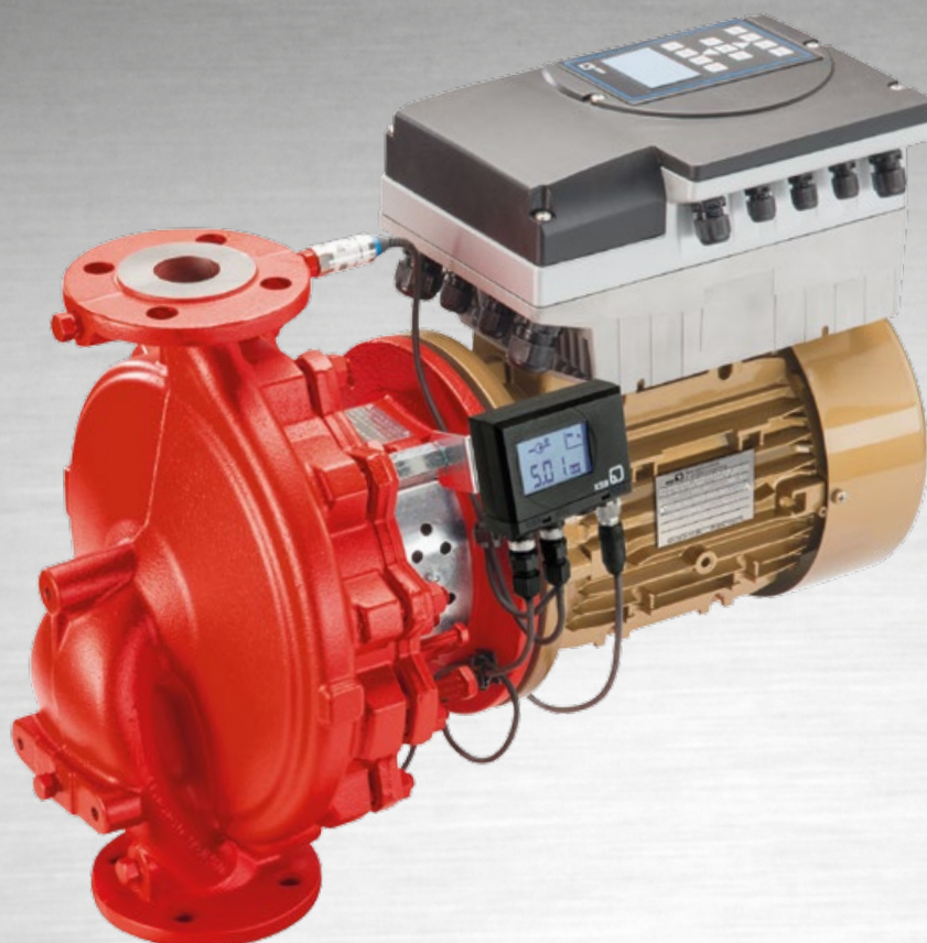
Etaline avec moteur KSB SuPremE®-IE5 *, PumpMeter et PumpDrive 2